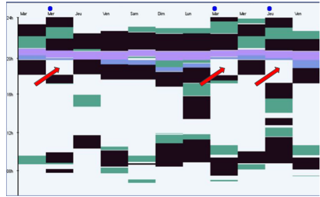
FIGURE 2 – Extrait d'un diagramme d'activité illustrant l'adaptation de l'activité des individus sous l'influence de leur foyer.

Grâce aux différents agents présentés ci-dessus, nous voyons la diversité des expertises nécessaires pour représenter le problème difficile de la simulation des comportements humains, même limitée au contexte résidentiel. Pourtant, la structure du problème en plusieurs axes de modélisation et la représentation unifiée des concepts en agents permettent d'avoir un modèle de simulation accessible aux experts. D'une part, ils restent proche de leur domaine